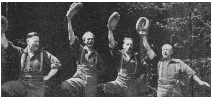
Photo : Charles Marchand et ses Troubadours de Bytown (Émile Boucher, Fortunat Champagne et Miville Belleau, coupure de presse, photographie parue dans La Lyre , Montréal, Québec, 1927. Université d'Ottawa, CRCCF, Fonds Émile-Boucher (P205), P205/10/6.

Dès le milieu du XIX e siècle, avant même la Confédération de 1867, on fonde de nombreux journaux. Pendant le siècle qui suivra, la presse française prendra beaucoup d'expansion et atteindra presque tous les coins de la province. Après la Deuxième Guerre mondiale, elle sera relayée par de nouveaux médias, dont la radio et la télévision, qui contribueront à la grande diversité des organes d'information franco-ontariens.