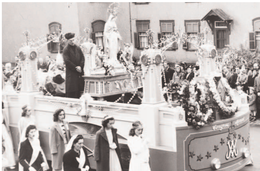
Congrès marial [char allégorique], [1947].